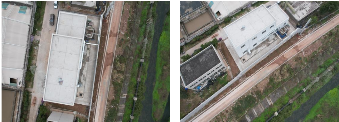
图1-2 取水泵房扰动现状

已全部完成，但在建筑物周围还未实施绿化，施工过程中严格控制了扰动范围，实施的各项水土保持措施防治水土流失效果明显（详见图1-2）。