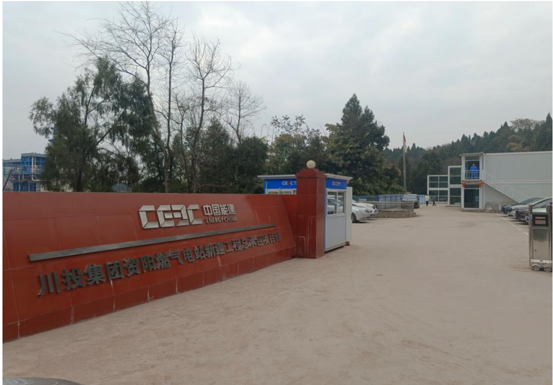
图2-1 现场施工营地及施工项目部

承包方(中国电力工程顾问集团西南电力设计院有限公司作为牵头方与中国能源建设集团广东火电工程有限公司组成联合体)在厂区北侧(位于资阳市安岳县永顺镇玉康村)设置了施工项目部以及施工营地,颁布了施工管理文件,提交了施工组织设计,施工管理人员全部到位,施工人员基本到位,并在各重要标段增投施工人员,保证本月施工进度稳步向前推进。