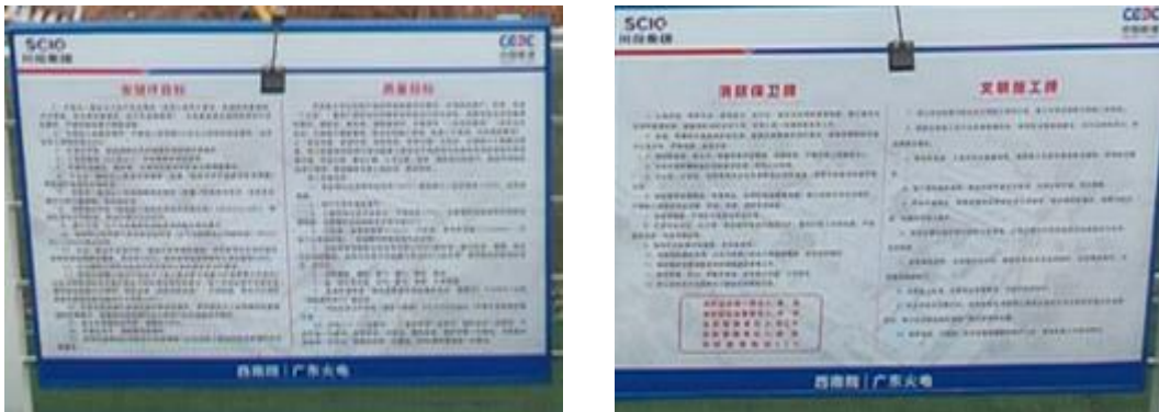
图7-1 安全文明施工标志牌、标语

施工单位本月做到了安全生产与文明施工，未发生安全生产事故。施工期间严控扰动范围，人员、机械未对征占地外造成扰动。