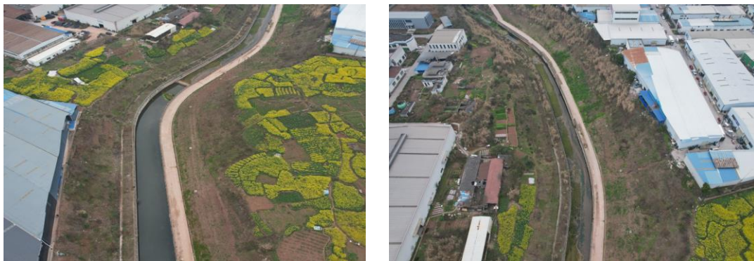
图1-3 取水管线工程区现状

截止本月（2024年3月），取水管线工程区管线沟槽已开挖完成，取水管道工程区域的土壤已全部回填完毕，扰动前区域为耕地的已全部实施耕地恢复，表土回填区域已实施了植物措施，对临时堆土区域采取了临时覆盖措施，采取了栽植乔木恢复植被，实施的各项水土保持措施防治水土流失效果较为明显。（详见图1-3）。