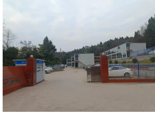
图1-4 施工生产生活设施现状