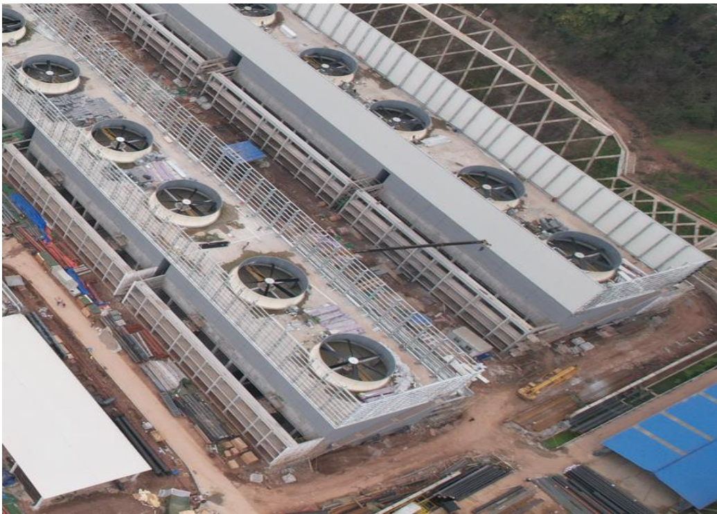
图1-5 表土临时堆放场区现状

截止本月（2024年3月），厂区及施工生产生活设施区已经场平完毕，场平前集中堆放在厂区东南侧一角的表土已全部回覆，厂区边坡区域及绿化区域已进行了表土回覆，实施的各项水土保持措施防治水土流失效果明显。（详见图1-5）。