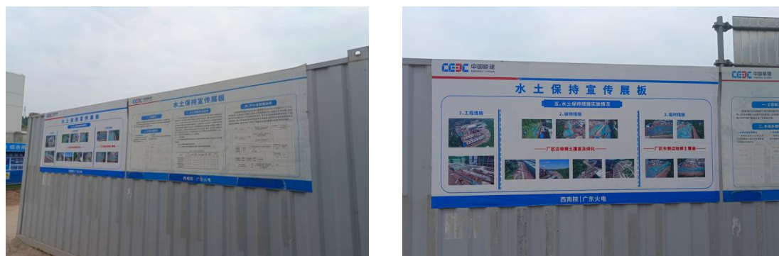
图7-2 水土保持宣传展示板

环境。施工单位编制了安全文明施工实施细则与绿色施工方案,在保证工程质量、安全管理的同时,落实了各项水保措施,基本做到了文明施工和环境保护,并在厂区布设水土保持宣传展示板,对过程中监理、监测资料在项目部进行公开。