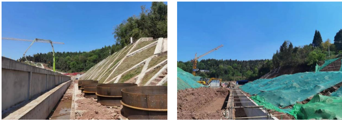
图1-8 厂区周围截水沟布设