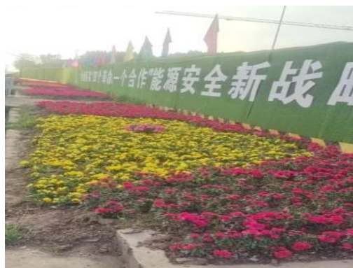
临时撒播植草绿化