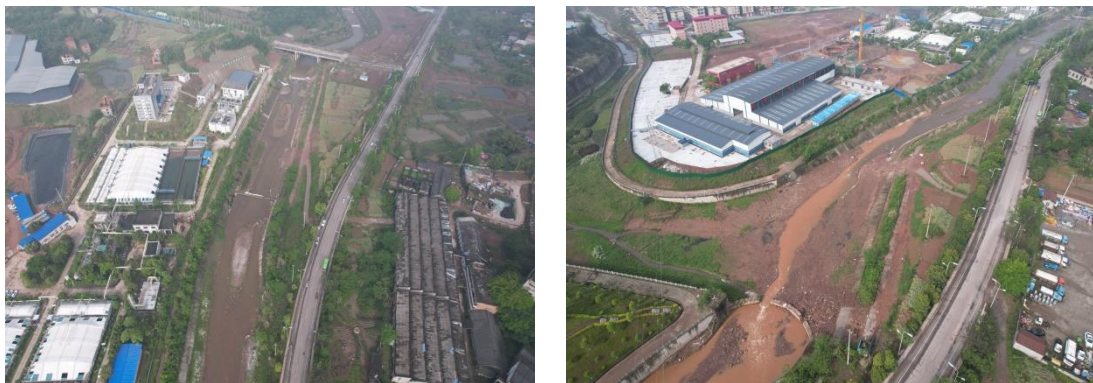
图1-9 取水泵房扰动现状