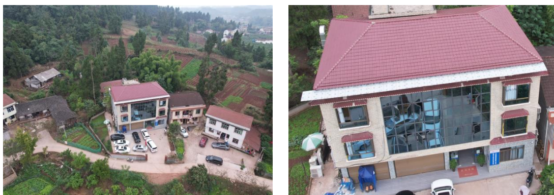
图2-1 现场施工营地及施工项目部(工程部)

承包方(中国电力工程顾问集团西南电力设计院有限公司作为牵头方与中国能源建设集团广东火电工程有限公司组成联合体)租用当地民房(位于资阳市安岳县永顺镇玉康村)设立了施工项目部以及施工营地,颁布了施工管理文件,提交了施工组织设计,施工管理人员全部到位,施工人员基本到位,并在各重要标段增投施工人员,保证本月施工进度稳步向前推进。