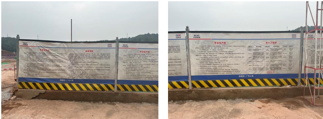
图7-1 安全文明施工标志牌、标语

施工单位本月做到了安全生产与文明施工，未发生安全生产事故。施工期间严控扰动范围，人员、机械未对征占地外造成扰动。