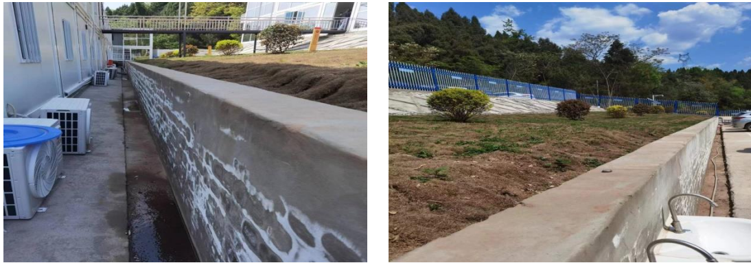
图1-11 施工生产生活设施现状

截止本月，位于厂区北侧的施工临建区域已经建成投产，场地已硬化，并实施了撒播植草、排水等措施。（详见图1-11）。