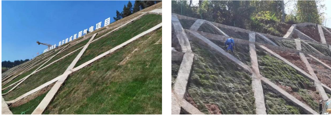
图1-7 边坡浆砌石护坡施工情况