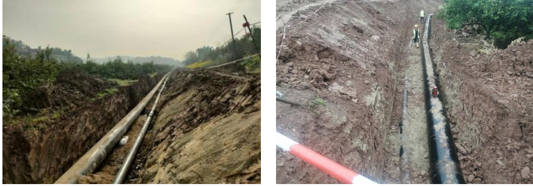
图1-10 取水管线工程区现状