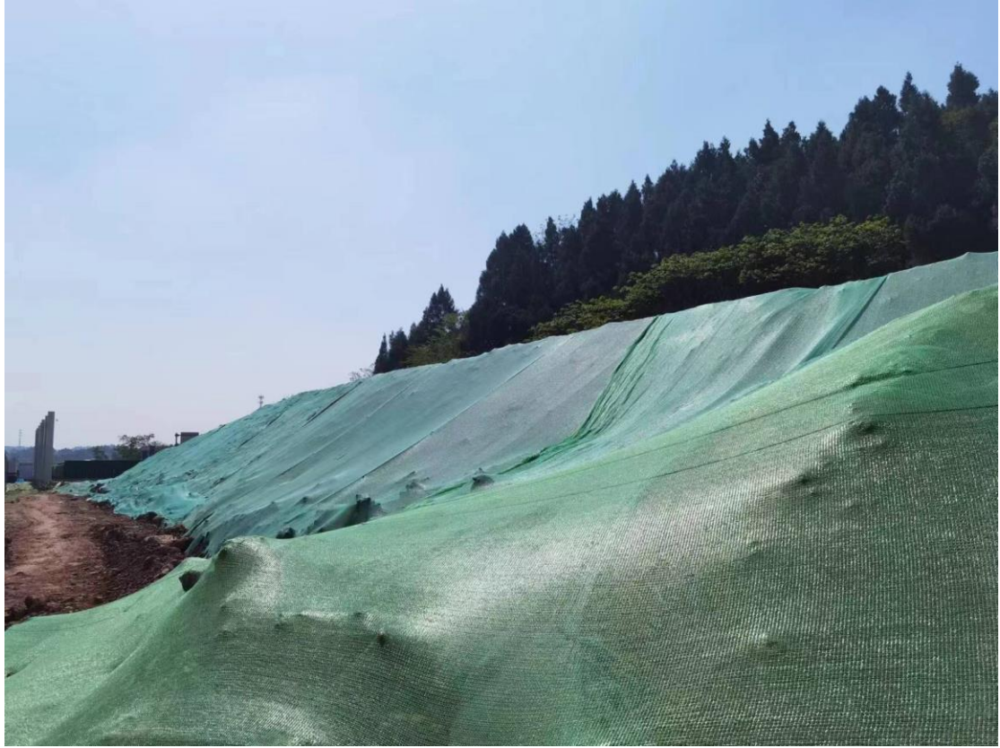
图1-12 表土临时堆放场区现状